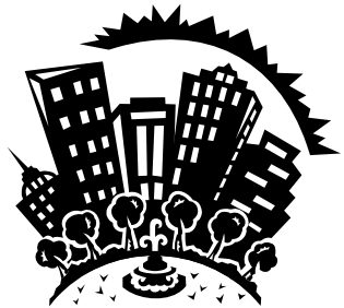
Caption describing picture or graphic.

A great way to add useful content to your newsletter is to develop