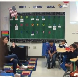
Primary College Pride Day Uplift Williams Preparatory