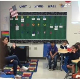
Primary College Pride Day Uplift Williams Preparatory